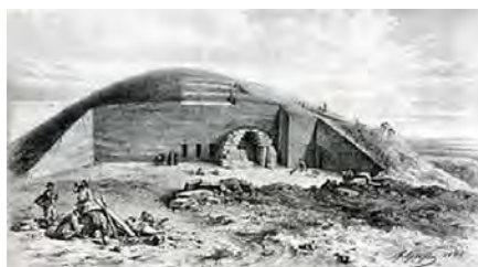
Олександропільський курган недалеко міста Дніпро. Сьогодні майже на видно слідів могили.