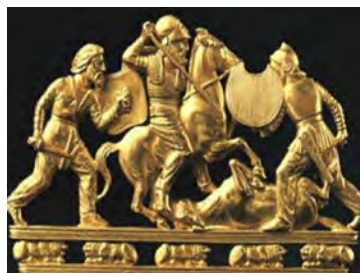
Кочове плем'я степу