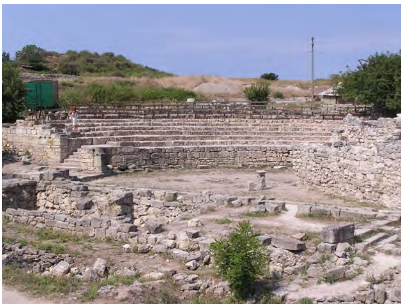
Античний Херсонес: амфітеатр