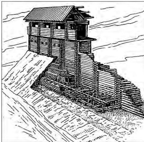
Вали із заборолом княжого міста (макет)

Будівничі-архітектори перших церков були чужоземні майстри. Але помагали їм місцеві майстри, які незабаром почали працювати самостійно. Літописи 12–13 століть згадують про архітекторів Петра Милонога та Олешка.