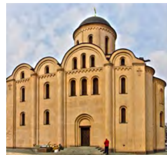
Церква Успіння Богородиці Пирогощі в Києві

Візантійська церква має знадвору простий, суворий вигляд, без розкішної орнаменталії. Натомість інтер'єр церкви прикрашений фресками, різнокольоровими мозаїками та іконами, що мають мету викликати враження гостини у Божому царстві. Стіни церкви і куполів мають багато вікон, які пропускають сонячне світло для освітлення фресок і мозаїк.