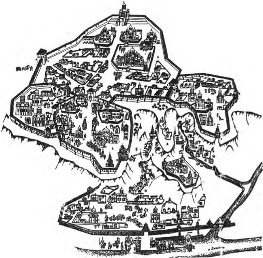
Реконструкція (вигляд) Києва у XI–XII ст.

У давніх, дохристиянських часах доми людей, тереми (палати), оборонні споруди і т. д. будувалися в Україні переважно з дерева. Вже тоді формувалися українські традиції будівництва, які довго у нас зберігалися були використані пізніше в нових родах будівель (наприклад, у будівництві дерев'яних церков). Однією такою традицією був поділ будов на три частини, як це є у традиційній українській хаті (з тим що середня — вхідна частина).