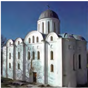
Борисоглібський собор у Чернівці

Поруч центрального купола візантійські церкви часто мають ще дві або чотири менші бані. Бувають також семибанні та дев'ятибанні церкви. Число бань має символічне значення: три Особи Трійці, Христос і чотири євангелісти, сім святих тайн і т. п. Бані є переважно круглої форми.