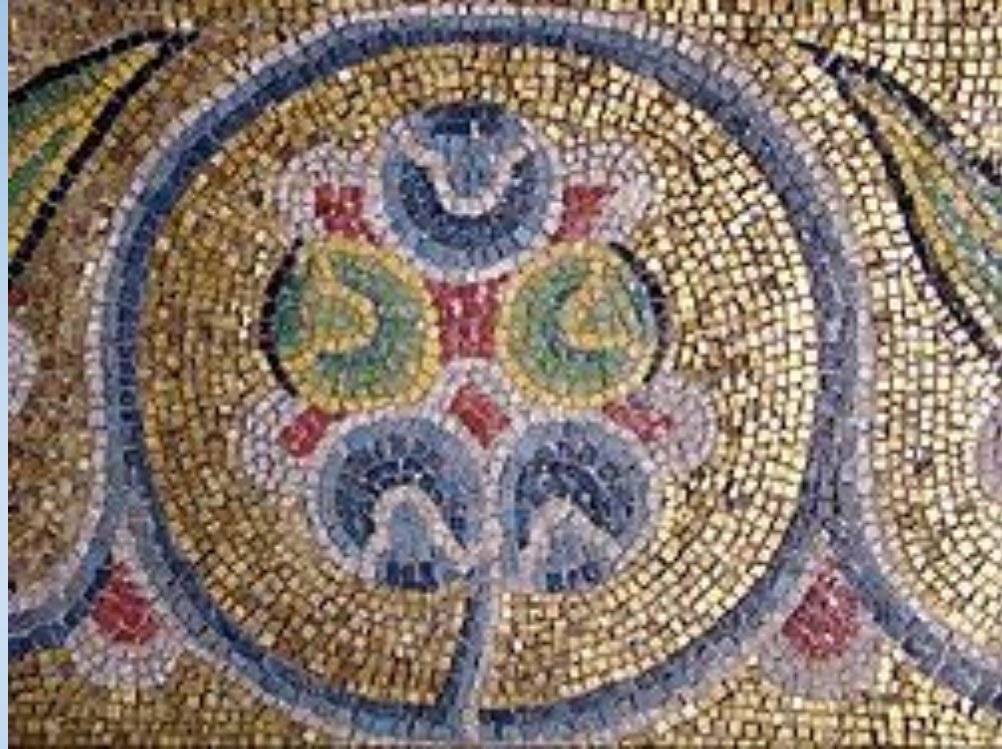
Смальтові мозаїки Софійського Собору, м.Київ (11 ст.)