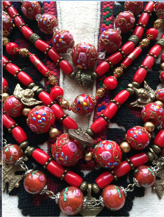
Венеційка або писані пацьорки ( Venetian beads )