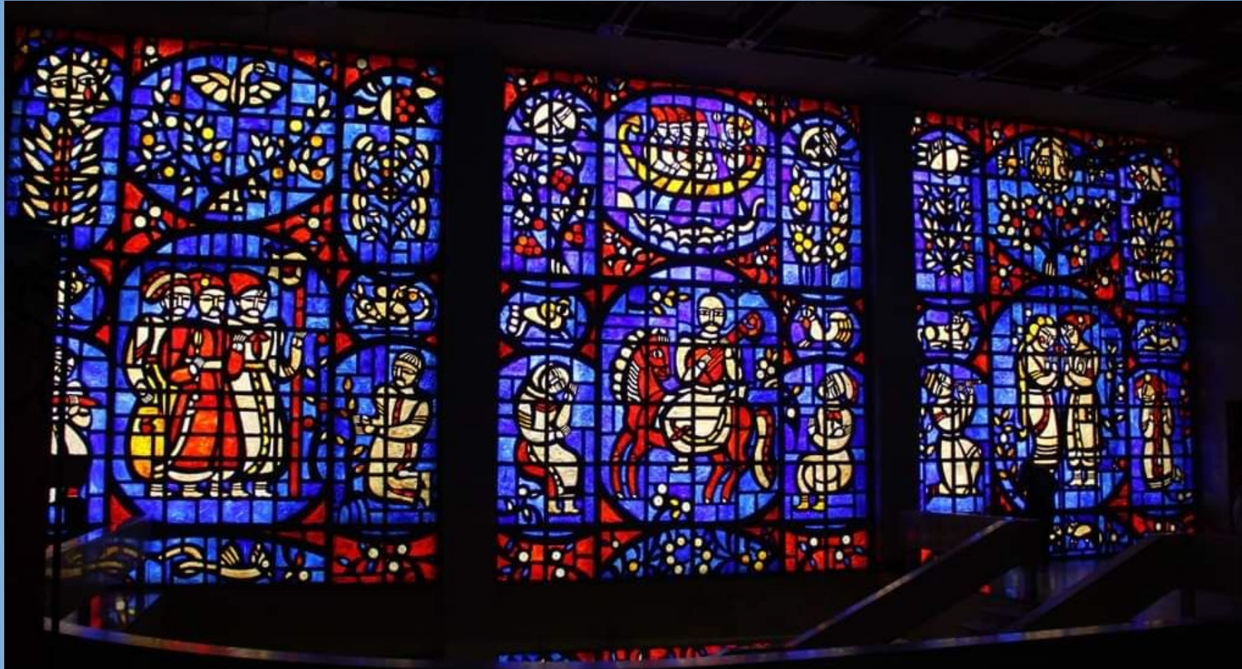
Вітраж Івана-Валентина Задорожного, 20 ст.