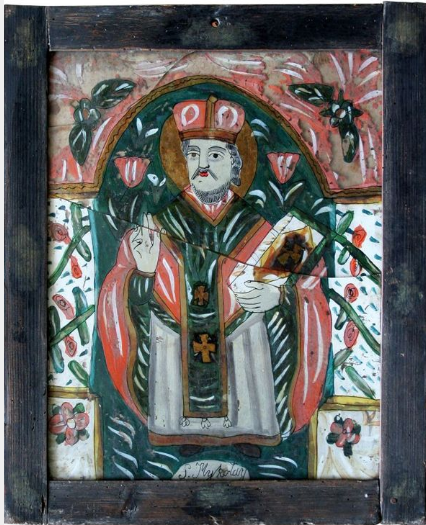
Образ святого Миколая, 19 ст.