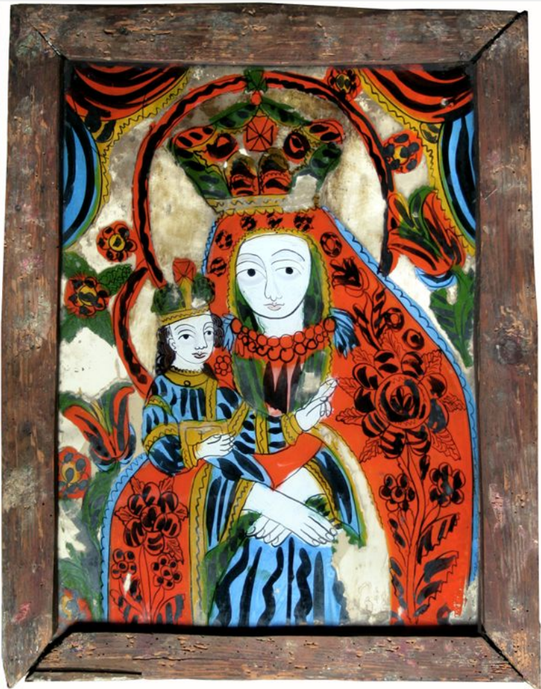
Богородиця з дитям, 19 ст.