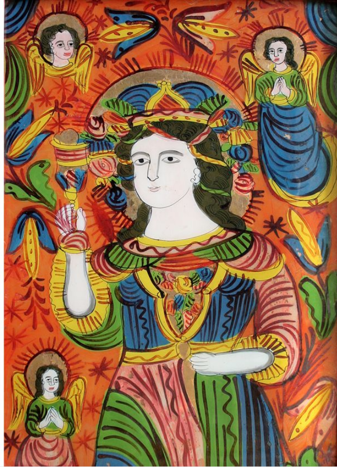
Св.Миколай(зліва), Св. Варвара(справа), ост. чверть 19 ст., скло, розпис, позолота. Образи походять з с. Криворівня Верховинського р-ну Івано-Франківської обл., НМЛ