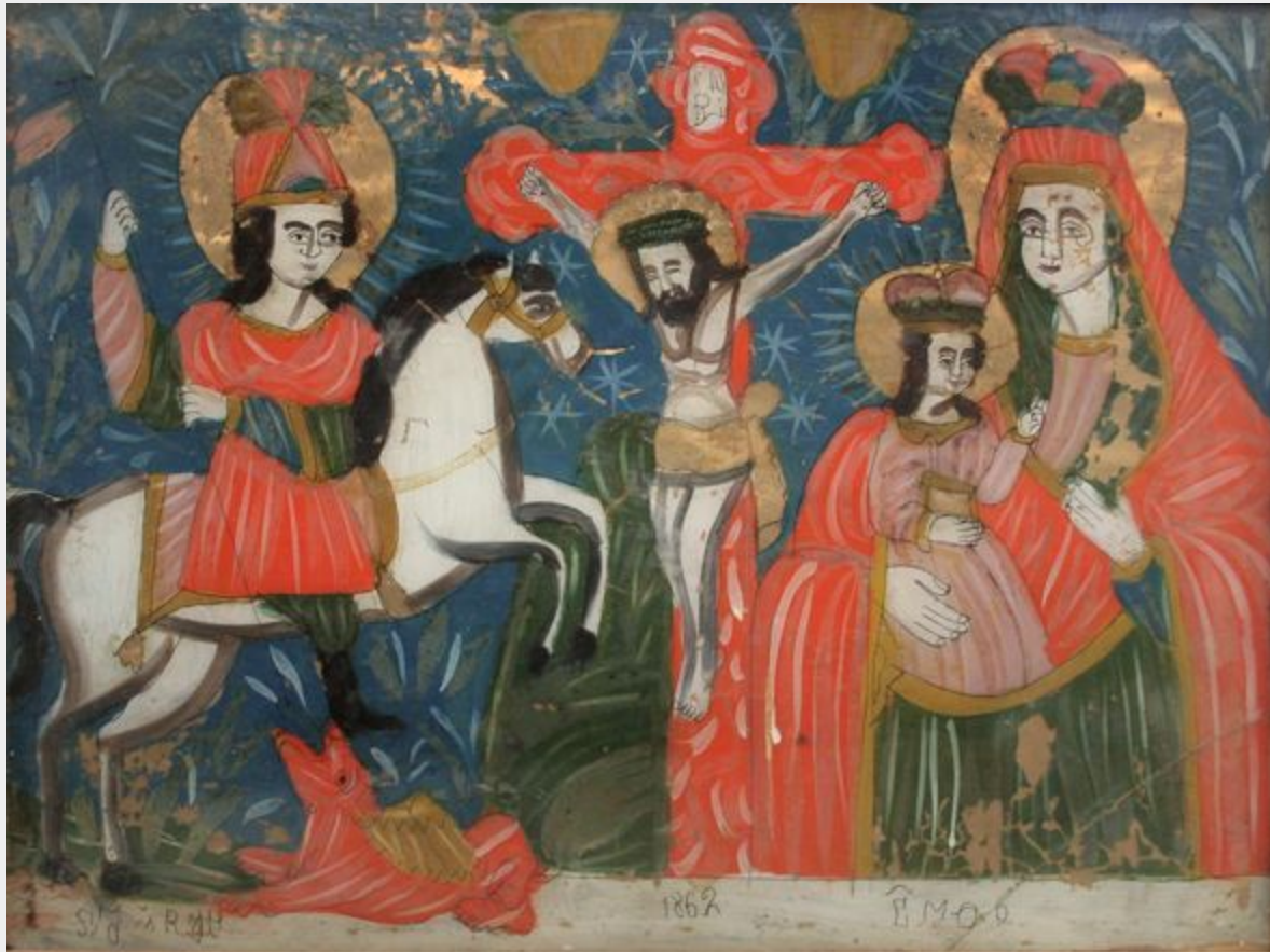
св.Юрій(зліва), Розп'яття (посередині) та Богородиця з Дитям,(справа), 1862 р. - найдавніша збережена українська ікона на склі.