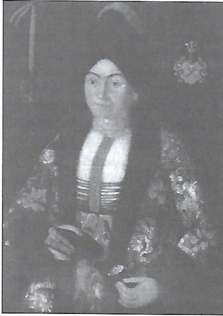
Портрет Парасковії Сулими, середина XVIII ст.

портрета та пейзажу. В другій половині XVII ст., слідом за модою на Заході, портрети почали набувати значної популярності в Україні. Свого часу була традиція замовляти на похорони портрети померлих, а в церквах розвішувати портрети своїх опікунів (“ктиторів”), що були переважно намальовані іконописцями. Згодом портрети стали важливим атрибутом домів знатних родів, а потім і міщанства.