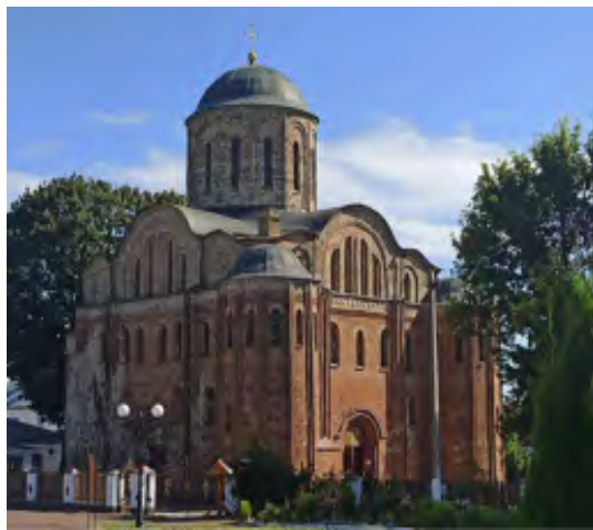
Церква св. Василя в Овручі