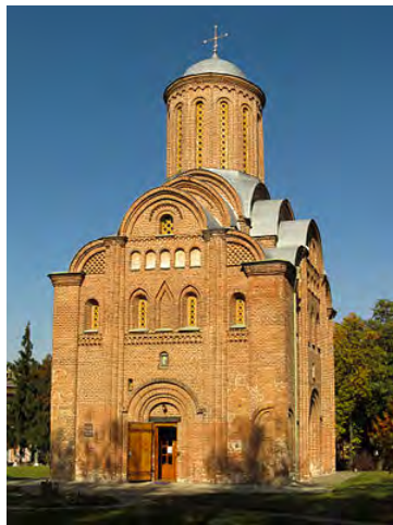
Церква св. П'ятниці у Чернігові

ГАЛИЧ — столиця Галицького князівства з 12 до 14 століть