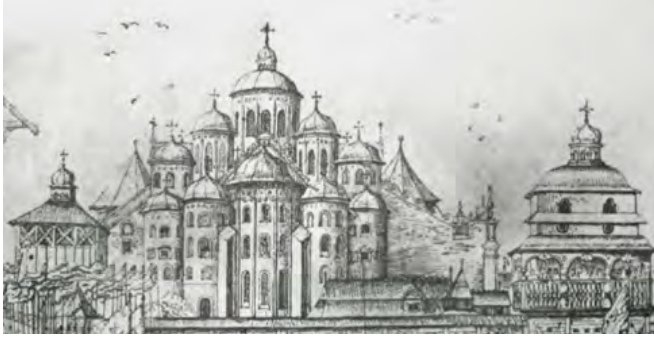
Первісний вигляд Софійського собору (малюнок голландця А. ван Вестерфельда. 1651 р.)

Собор має 13 куполів / бань, що символізують Ісуса Христа і 12 апостолів. Вони первісно були розташовані в пірамідальну композицію. Найвища баня була оточена нижчими банями, а ті ще нижчими і т.д.