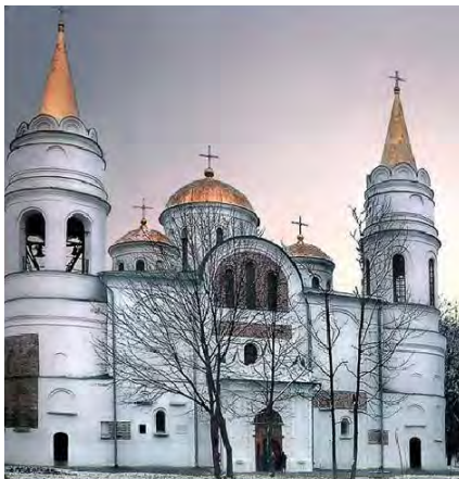
Спаський собор у Чернігові