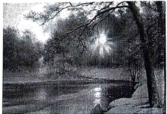
▲ Євгеній Карлович. Зима (2010-ті рр.)

Діти ще деякий час стояли на місці й обмірковували, як лось міг потрапити у воду. Та коли він заборсався, а потім надовго притих, підберезники втямили, що з ним сталося. Старший майнув до саней по сокиру, а молодший повільно пішов уперед, боячись сам підійти до лося перше, ніж наспіє брат. Лось уже зовсім знесилився. Усе нижче осідав у воду, і роги похитувались над крижаним місивом, як