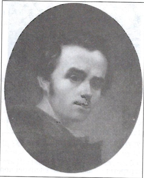
Т. Шевченко, автопортрет, 1840 р.

Будучи кріпаком, він був позбавлений права навчатись у мистецькій школі. Але завдяки своїм природним здібностям він привернув до себе увагу передових малярів українського та російського походження, які викупили його з кріпацької неволі. Це дало йому змогу вступити до Академії Мистецтв у Петербурзі. Шевченко планував заснувати у Києві мистецьку школу, але на перешкоді цьому став його арешт на 34-тому році життя. За час студій Шевченко був тричі нагороджений срібними нагородами. Згодом, недовго перед його смертю, Академія наділила його високим званням академіка гравіюри.