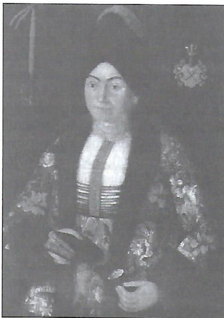
Портрет Парасковії Сулими, середина XVIII ст.

портрета та пейзажу. В другій половині XVII ст., слідом за модою на Заході, портрети почали набувати значної популярності в Україні. Свого часу була традиція замовляти на похорони портрети померлих, а в церквах розвішувати портрети своїх опікунів (“ктиторів”), що були переважно намальовані іконописцями. Згодом портрети стали важливим атрибутом домів знатних родів, а потім і міщанства.