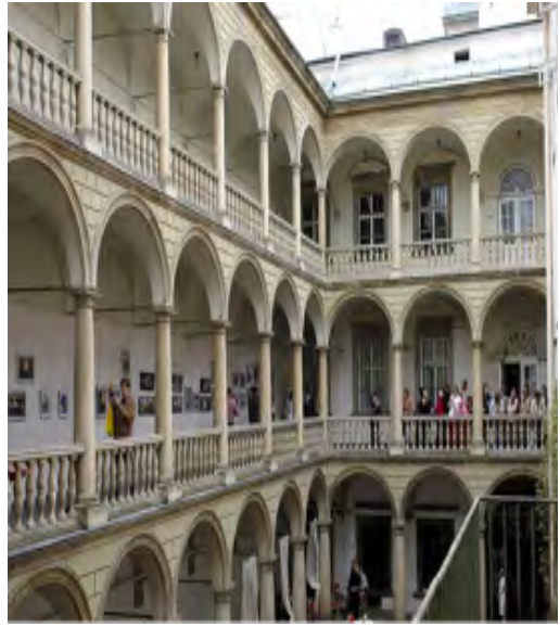
Італійський дворик (подвір'я) палацу Корнякта