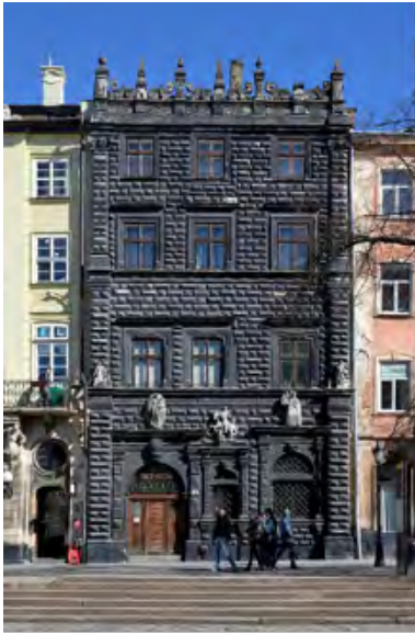
Чорна кам'яниця у Львові