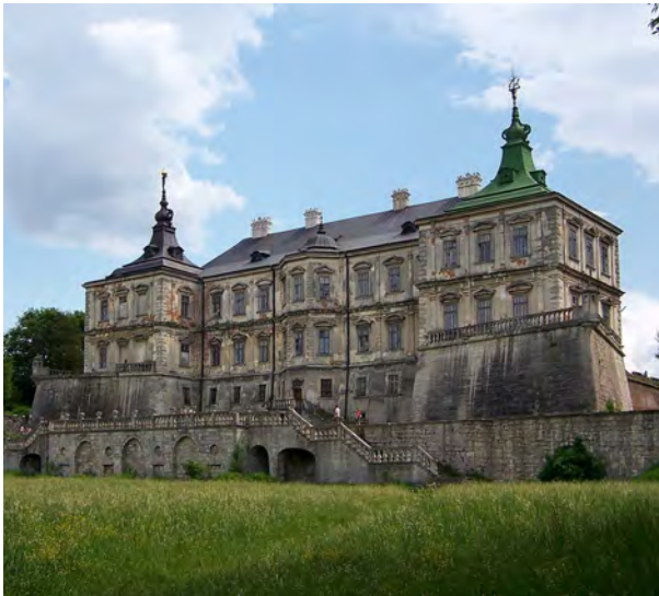
Замок у Підгірцях