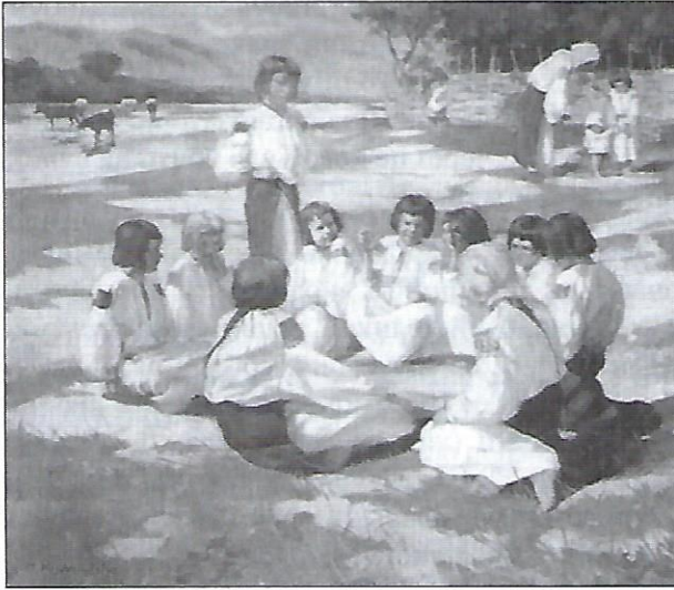
О. Кульчицька, Діти на леваді . 1908. олія.

ОЛЕНА КУЛЬЧИЦЬКА малювала різними фарбами (олією, акварелю, темперою) і на різні теми: портрети, краєвиди (переважно Карпат), картини на історичні та побутові теми і з гуцульської мітології. Також творила книжкові ілюстрації, особливо для дитячих видань. Багато черпала з українського народного мистецтва. Великою цінністю є її акварелі народного одягу й архітектури земель Західньої України.