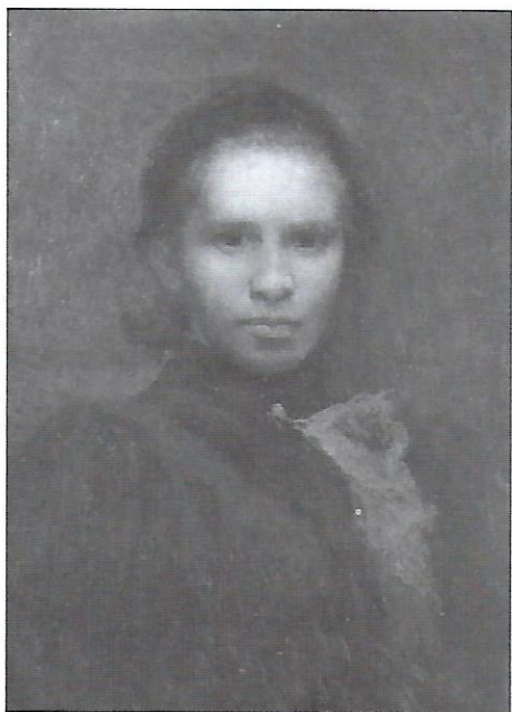
І. Труш. Портрет Лесі Українки. 1900, олія.

ОЛЕКСА НОВАКІВСЬКИЙ вважається найбільшим українським імпресіоністом. Його картини відзначаються динамічним висловом та емоційним (експресивним) використанням кольорів. Свій великий талант Новаківський виявив у різних жанрах: пейзажі (Карпат, заходу сонця, собору св. Юра у Львові), портрети (дружини, митрополита А. Шептицького та інших діячів, численні автопортрети), історичні портрети (князя Осьмомисла, Довбуша), алегоричні композиції ("Пробудження", "Мистецтво", "Наука", "Народна Пісня"), натюрморти і т. д. Під впливом переживань з Першої світової війни, Новаківський почав малювати у стилі символічного експресіонізму у відповідь на катаклізми своєї доби (експресіонізм прагне розкрити внутрішнє сприйняття подій людиною, її емоційні переживання, жертвуючи цьому реальне зображення предметів чи подій). В своїх символічних композиціях він намагався втілити філософічні роздуми про зміст і драму людського життя. Навіть природа у його натюрмортах експресивна, і відчувається прагнення мистця знайти відраду в красі та багатстві природи. Окрема заслуга Новаківського — це створення мистецької школи (при фінансовій підтримці митрополита А. Шептицького), з якої вийшло близько 60 малярів високої кляси.