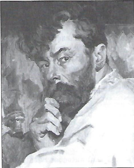
О. Новаківський, Автопортрет. 1911. Олія.

Імпресіонізм знайшов багато прихильників серед українських мистців. Для них була близькою його багатобарвність і зображення природи у яскравих кольорах.