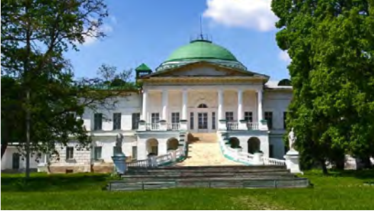
Палац Галаганів у Сокиринці (Чернігівщина)