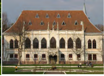
Палац у Львові