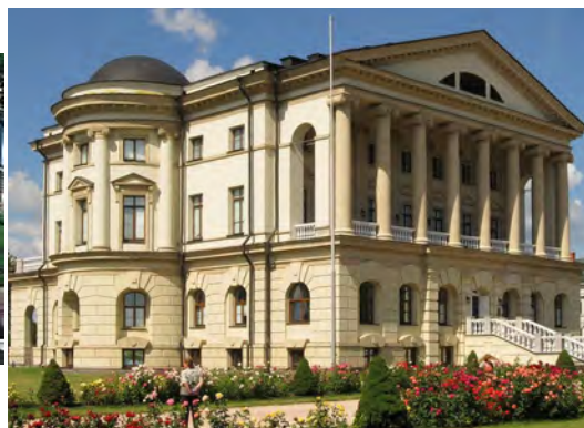
Палац Розумовського в Батумі