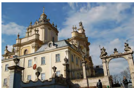
Собор св. Юра у Львові