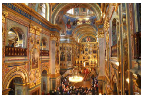
Інтер'єр Собору Почаївської Лаври