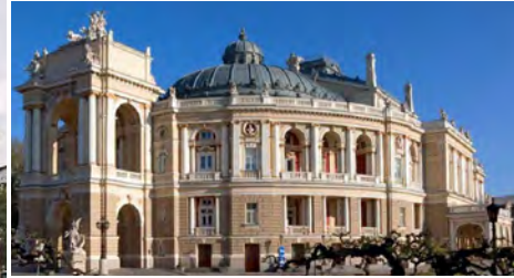
Оперний театр в Одесі