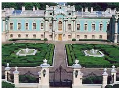
Маріїнський палац в Києві