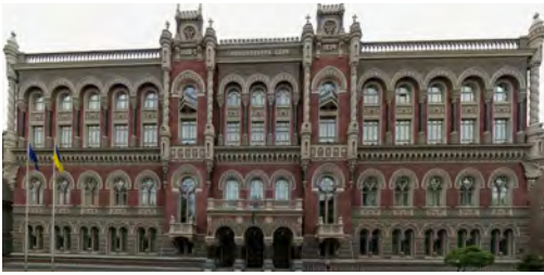
Національний Банк у Києві