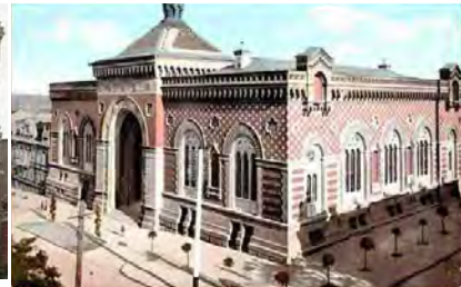
Товарна біржа в Одесі