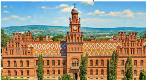
Чернівецький університет (колись резиденція митрополитів Буковини)