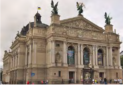
Оперний театр у Львові