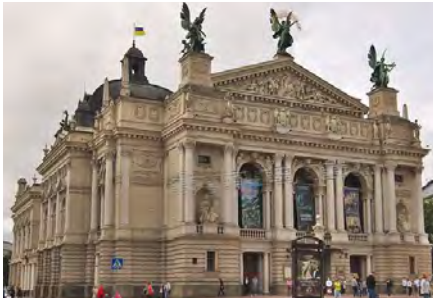
Оперний театр у Львові