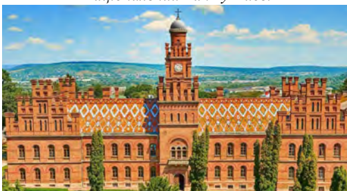
Чернівецький університет (колись резиденція митрополитів Буковини)