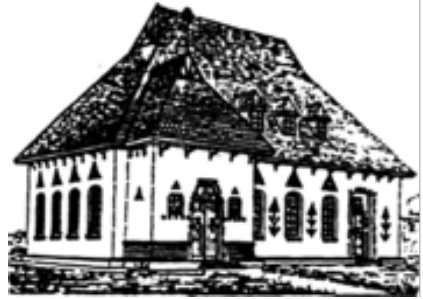
Будинок кооперативи в с. Косівка