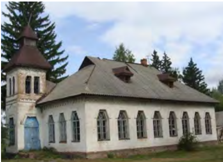
Школа в селі Яблунівка на Полтавщині