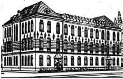
Школа в Києві