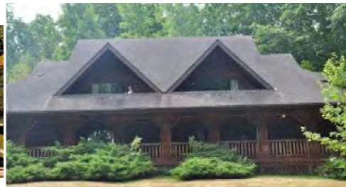
Мотель «Галич» на оселі Союзівка (США)