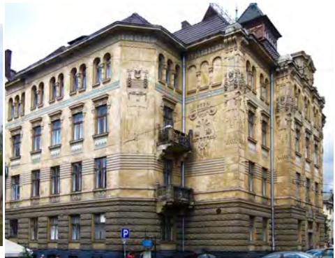
Будівля банку «Дністер» у Львові