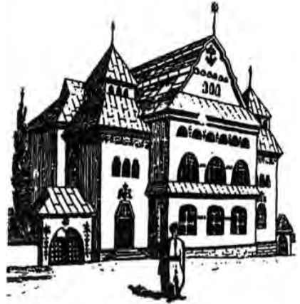
Проект музею в Кам'янці Подільському