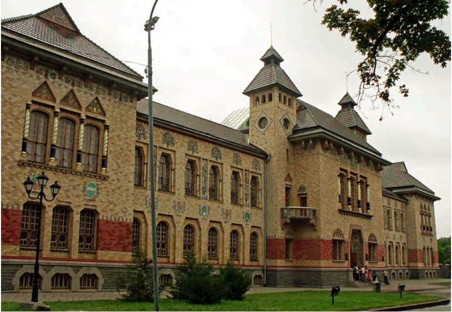
Будинок полтавського земства (тепер Краєзнавчий музей)