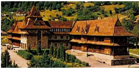
Готель «Гуцульщина» в Яремчі