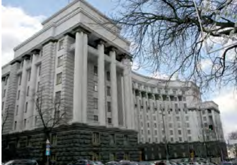
Будинок Уряду УРСР / України у Києві.