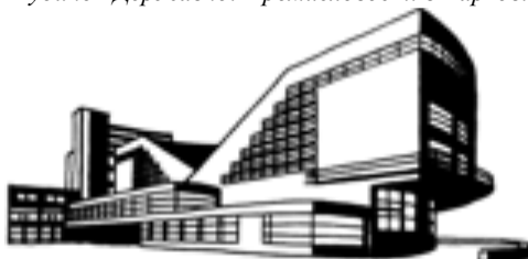
Проект палацу культури 2