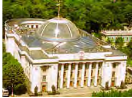
Будинок Верховної Ради України