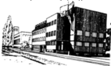
Проект дому 2