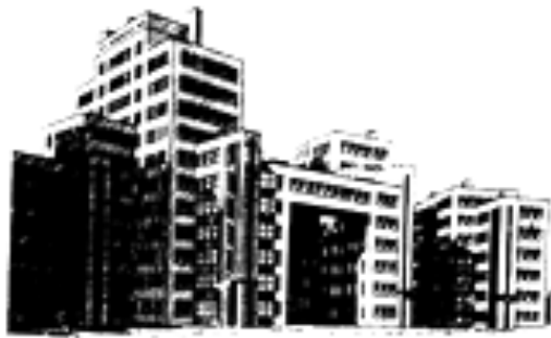
Будинок Державної Промисловості в Харкові 2

Вправа-аналіз: Напишіть свої міркування про архітектуру 1920-х років на базі нижчеподаних малюнків будівель того часу. 6