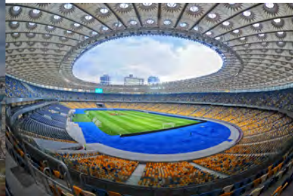
Спортивний комплекс «Олімпійський» у Києві.

У такому стилі побудовано будинок Верховної Ради України, будинок Ради Міністрів, будівлі на Хрещатику (головній вулиці Києва, яку треба було майже повністю перебудувати після його знищення в Другій світовій війні), санаторії в Криму, спортивні стадіони і т. д.