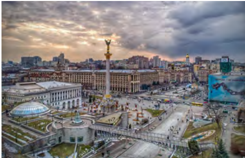
Майдан Незалежності в Києві