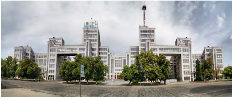
Будинок Державної Промисловості в Харкові