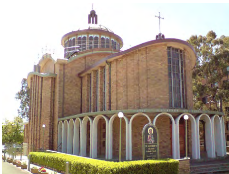
Церква св. Андрія в Сідней, Австралія

Вправа-аналіз: Розгляньте будівлі на цій сторінці. Усі вони поставлені українцями в діаспорі. Відтак дайте відповіді на запитання внизу. 10