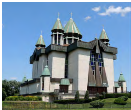
Церква Пресвятої Богородиці в Місісага, Канада