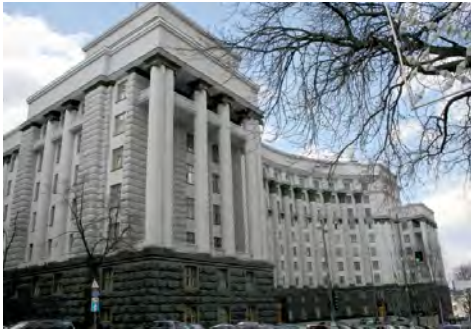
Будинок Уряду УРСР / України у Києві.